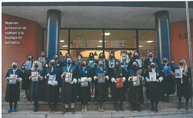
Nuevas protestas se suman a la huelga de letrados.